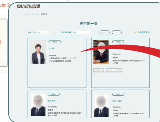
専門家一覧から貴社のページへ