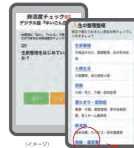
(イメージ) 終活度を約5分で診断する「終活度チェック60」

無料版「終活度チェック 60」は60の質問に「はい」「いいえ」で答えるだけで終活に必要な項目が「見える化」する、弊社オリジナルのツールです。その結果が表示される画面から「終活に必要な情報項目別」ページに飛び、そこにアップされているバナー広告を見たユーザー様が直接、貴社様にアクセスします。