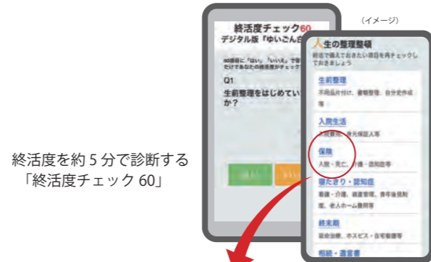
終活度を約5分で診断する「終活度チェック 60」