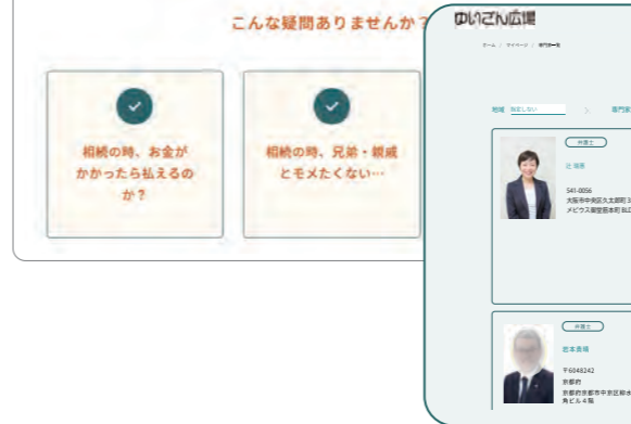
専門家一覧から貴社のページへ